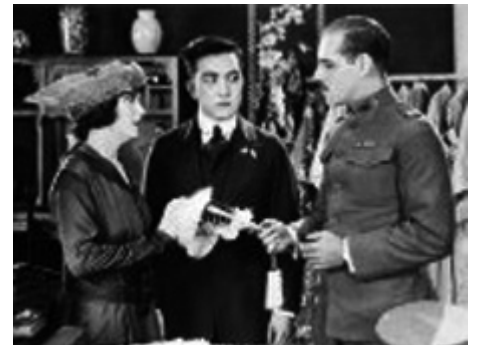
1917 LE JEU SECRET (The Secret Game) de William C. De Mille avec Sessue Hayakawa, Jack Holt