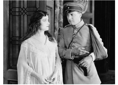
1918 TILL COME BACK TO YOU de Cecil B. De Mille avec Btyan Washburn