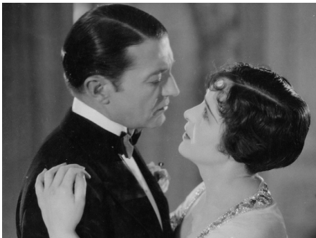
1926 THE POPULAR SIN de Malcolm St. Clair avec Clive Brook