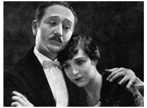
1925 THE GRAND DUCHESS AND THE WAITER de Malcolm St. Clair avec Adolphe Menjou