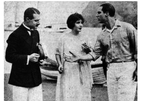
1922 LA CONQUÊTE D'UNE FEMME (Conquering the Woman) de King Vidor avec Roscoe Karns, D. Butler