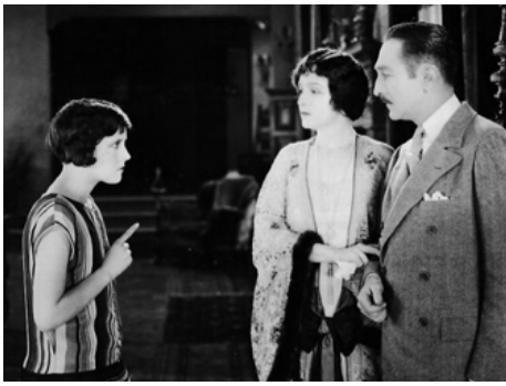
1925 ARE PARENTS PEOPLE ? de Malcolm St. Clair avec Betty Bronson, Adolphe Menjou