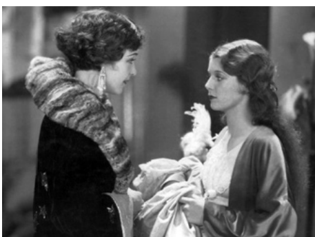
1928 THE MAGNIFICENT FLIRT de Harry d'Abbadie d'Arrast avec Loretta Young