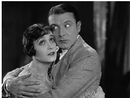
1927 LA PEUR D'AIMER (Afraid to love) d'Edward H. Griffith avec Clive Brook