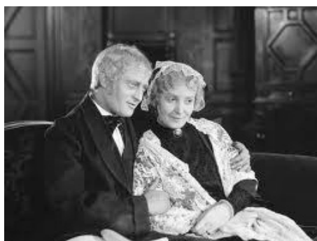
1924 BARBARA FRIETCHIE (Barbara Frietchyie) de Lambert Hillyer avec Edmund Lowe