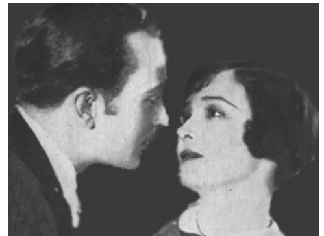
1927 LE MONDE À SES PIEDS (The World at her feet) de Luther Reed avec Arnold Kent