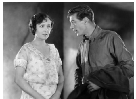
1927 DOOMSDAY de Rowland V. Lee avec Gary Cooper