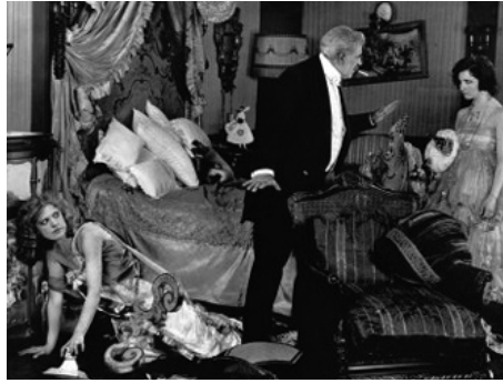
1918 L'ÉCHANGE (Old Wives for new) de Cecil B. de Mille avec Gloria Swanson, Elliott Dexter