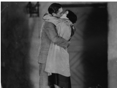
1927 D'UNE FEMME À L'AUTRE (One Woman to another) de Frank Tuttle avec Theodore von Eltz