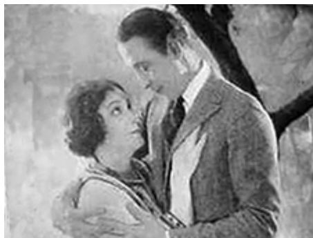
1923 LA RUE DES VIPÈRES (Main Street) de Harry Baumont avec Monte Blue