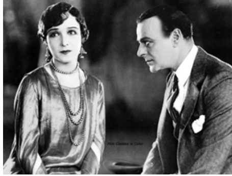
1926 MASQUES D'ARTISTES (You never know Women) de William Wellman avec Lowell Sherman