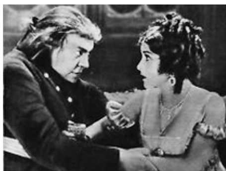
1928 LE PATRIOTE (The Patriot) d'Ernst Lubitsch avec Emil Jannings