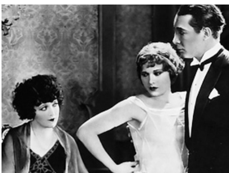
1923 COMÉDIENNES (The Marriage Circle) d'Ernst Lubitsch avec Marie Provost, Monte Blue