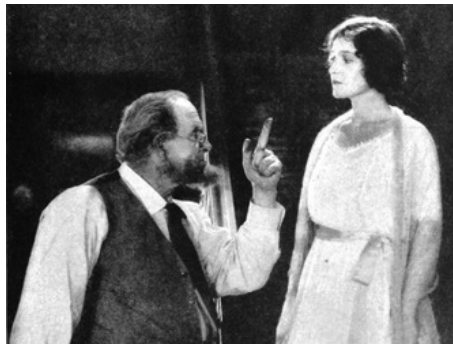
1921 HAIL THE WOMAN de John Griffith Wray avec Theodore Roberts