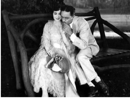
1925 À TRAVERS LES RÉCIFS (Sea Horses) d'Allan Dwan avec William Powell