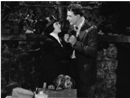
1920 LÈVRES MENTEUSES (Lying Lips) de John Griffith Wray avec House Peters