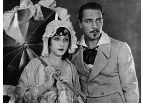
1926 LE CORSAIRE MASQUÉ (The Eagle of the Sea) de Frank Lloyd avec Ricardo Cortez